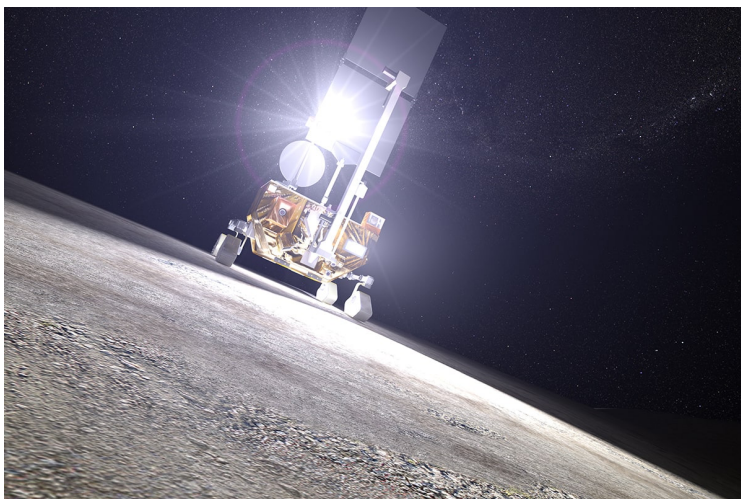
LUPEX ローバのクレータ走行(イメージ)

LUPEX は月の水資源が将来の持続的な宇宙探査活動に利用可能か判断するために、水の量と質に関するデータを取得するミッションです。この水資源調査では、月面環境でローバを観測地点まで安全且つ正確に移動するための航法誘導制御技術が求められます。三菱重工が開発するローバシステムは、正確な航法誘導制御を実現するための重要な機能として、画像航法による自己位置推定を実施する計画です。