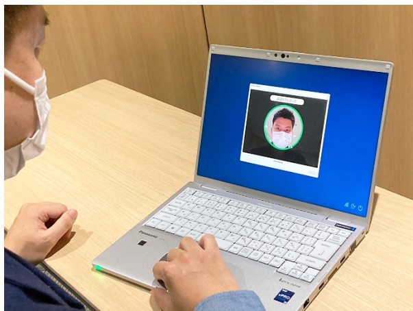
SmartOn での認証イメージ

株式会社ソリトンシステムズ（本社：東京都新宿区、以下「ソリトンシステムズ」）とパナソニック コネクト株式会社（本社：東京都中央区、以下「パナソニック コネクト」）は、多要素認証ツールと認証テクノロジーを連携したソリューションで共創を開始します。第一弾として、2022年12月20日よりパナソニック コネクトの顔認証技術を搭載した PC ログオンソフト「SmartOn」の新版をソリトンシステムズから発売します。