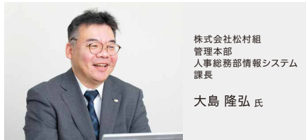
株式会社松村組 管理本部 人事総務部情報システム 課長

さらに、コストパフォーマンスでもOneGateの採用には優位性があった。「グループ内の他の企業は、当初検討していた他の製品を使っているのですが、その製品の提案を受けると導入には数千万円かかると言われました。その点OneGateは、ユーザー数や実現したいことに見合うコストで導入することができ、費用対効果の面で魅力的でした。セキュリティへの要求度を高くしすぎると使いにくくなる、といった懸念を払しょくできる運用性の高さは先ほど述べた通りでしたので、あまり迷うことはありませんでした」